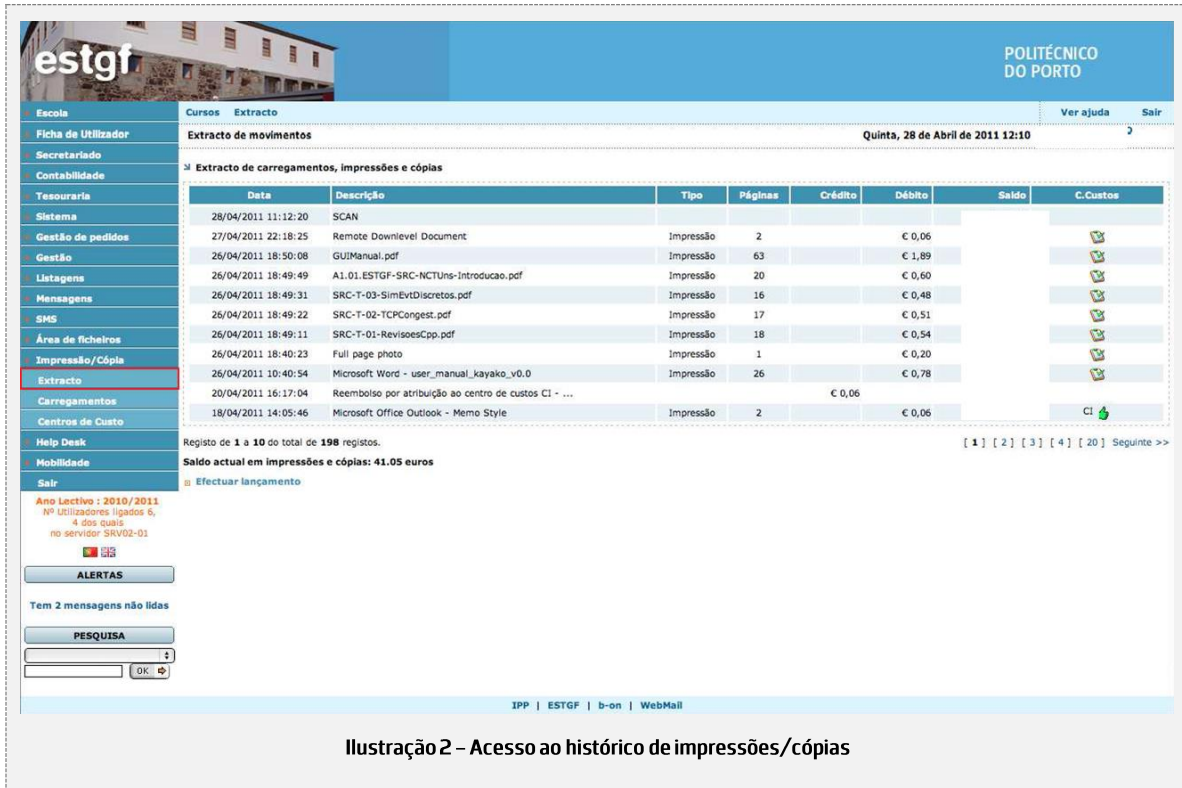
Ilustração 2 – Acesso ao histórico de impressões/cópias

Para visualizar o histórico de impressão/cópia clique no submenu Extracto :